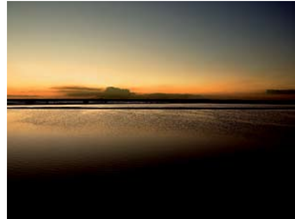
Puesta de sol en las Marismas del Odiel

Este Paraje Natural cuenta con el Centro de Recepción e Interpretación de Calatilla, que pone a disposición del visitante diferentes recursos para conocerlo. A la red de senderos de acceso libre, que disponen de varios miradores, y las áreas interpretativas, se suma una oferta de itinerarios guiados organizados por la empresa Onubaland. Pueden realizarse a pie, en tren o en barco, y discurren por diferentes zonas restringidas en compañía de un guía experto que aporta información sobre la particularidades del entorno y la diferente avifauna. Los recorridos por las proximidades de las salinas permiten un avistamiento tan cercano de aves como los flamencos que sin duda el visitante agradecerá la visita a este rincón superlativo de la naturaleza onubense.