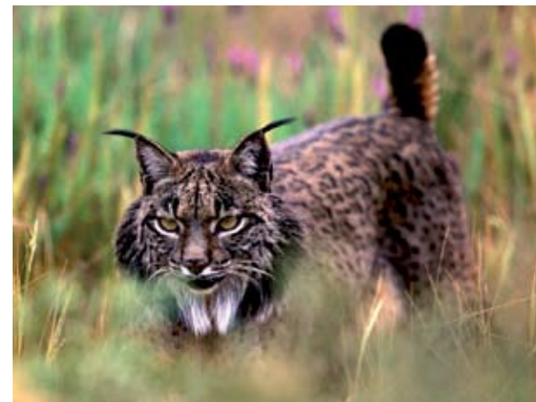
Ejemplar de Linco ibérico

Más de trescientas especies distintas de aves pueblan las marismas en diferentes épocas del año. Algunas hacen de ellas su cuartel de invierno, como el ánsar