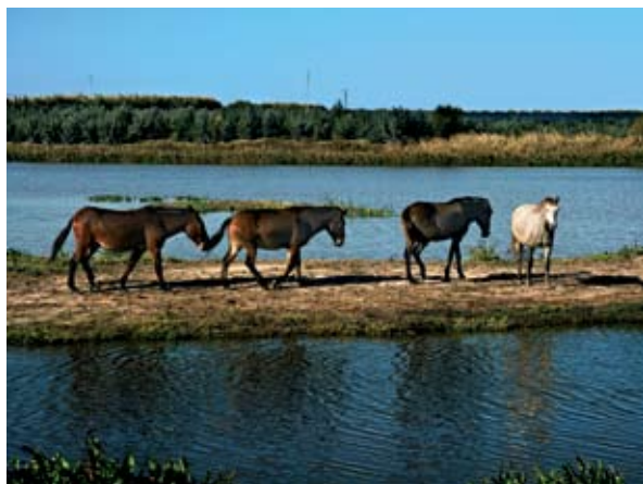
Laguna de Palos y las Madres, cerca de Mazagón

Al Centro de Visitantes “La Rocina” se accede también siguiendo la carretera A-483 y tomando una desviación posterior situada en las proximidades de la aldea de El Rocío. Este centro ofrece opciones divulgativas que incluyen una exposición dedicada a la romería rociera dentro de una vivienda ambientada al estilo tradicional.