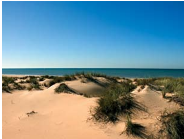
Paisaje dunar del Parque Nacional de Doñana

Estrictamente unido al Parque Nacional, al que rodea en casi su totalidad y con el que comparte ecosistemas, el Parque Natural de Doñana cubre una extensa región de 53.835 hectáreas que en la provincia de Huelva alberga joyas como la espectacular duna del Asperillo, los pinares y lagunas de Hinojos, que reciben miles de aves acuáticas al inundarse, y las lagunas del Abalarío. A la conjunción de ambos parques hay que añadir en la comarca otras 2.040 hectáreas más con diferentes grados de protección.