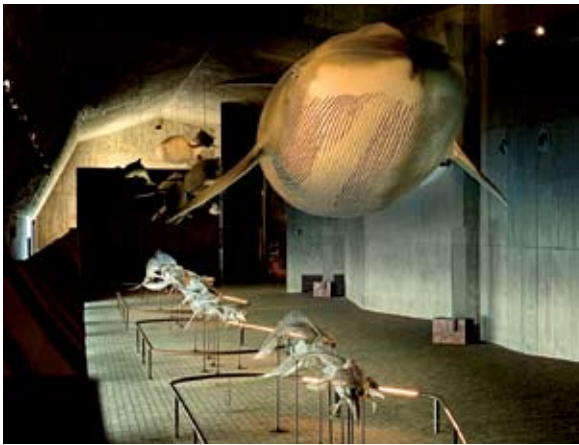
Museo del Mundo Marino en Matalascañas

En España la legislación vigente permite el tránsito peatonal por todo su perímetro costero, y las playas pertenecientes al parque no son una excepción. Partiendo de Matalascañas se puede recorrer un bellissimo tramo de costa de más de treinta kilómetros que discurre